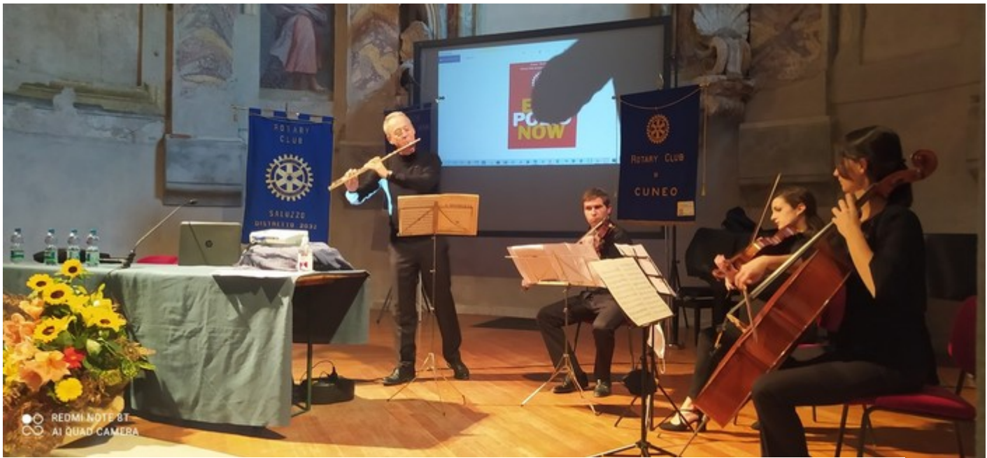
Alcuni momenti della conferenza Rotary

In sala San Giovanni a Cuneo, si è appena svolta la conferenza dal titolo "Il Rotary ha sconfitto la polio e non solo...".