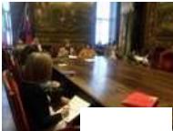
Attualità Anche a Cuneo arriva l'iniziativa "Punta su di te"