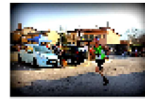
Running: Mattone e Moletto vincono i Sentieri Cervaschesi

Sue opere si trovano in collezioni private in Italia e all'estero tra cui il Museo Stauros e la collezione Bulgari. Nel 2013 ha realizzato il doppio ritratto di Lucia Bosè e Magaly Solier utilizzato per il manifesto del film "Alfonsina y el mar".