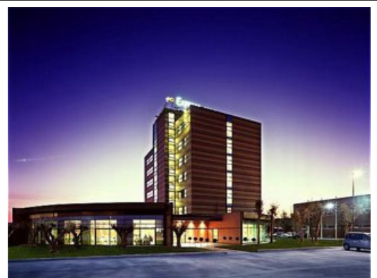
Un'immagine del Ristorante che ospiterà l'evento.

Si è svolta Mercoledì 17 Gennaio la riunione definitiva con i Presidenti dei Rotary Clubs di Bra, Saluzzo e Savigliano (nostri padrini) ed il direttivo del "Monviso" nella quale è stata definita l'organizzazione del Primo "Gran Ballo di Primavera", la serata danzante i cui proventi saranno parzialmente devoluti al Progetto A.P.I.N. a favore dell'associazione "Umberto Veronesi" per la lotta ai tumori ed in parte messi a disposizione per l'organizzazione del "Vado a Gonfie Vele IV".